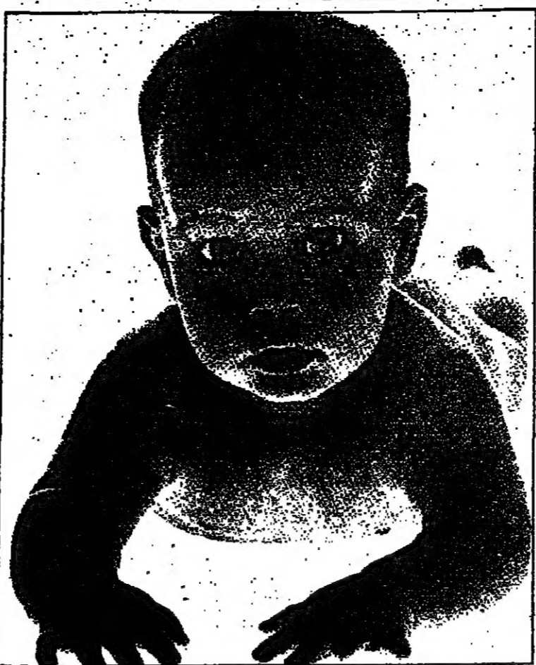
ثلاث مرات في الاسبوع ثم مرتين... ودائما وفق الشروط المذكورة. ان العناية بنظافة ثياب الطفل لا تقل اهمية من العناية بنظافة جسمه... اذا ما ناداة جسم نظيف يرتدي ثيابا نظيفة؟